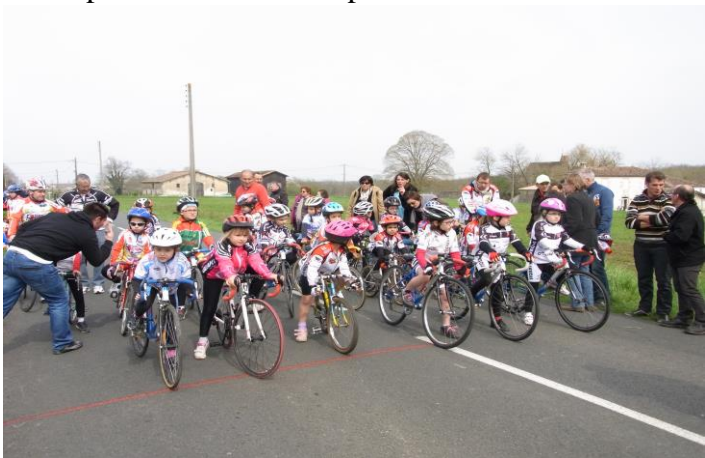
Ecoles de cyclisme le 07 avril