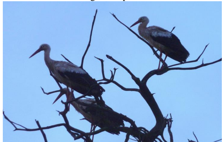
Arrivée de cigognes au lieu-dit « Cabannes » le 11 avril