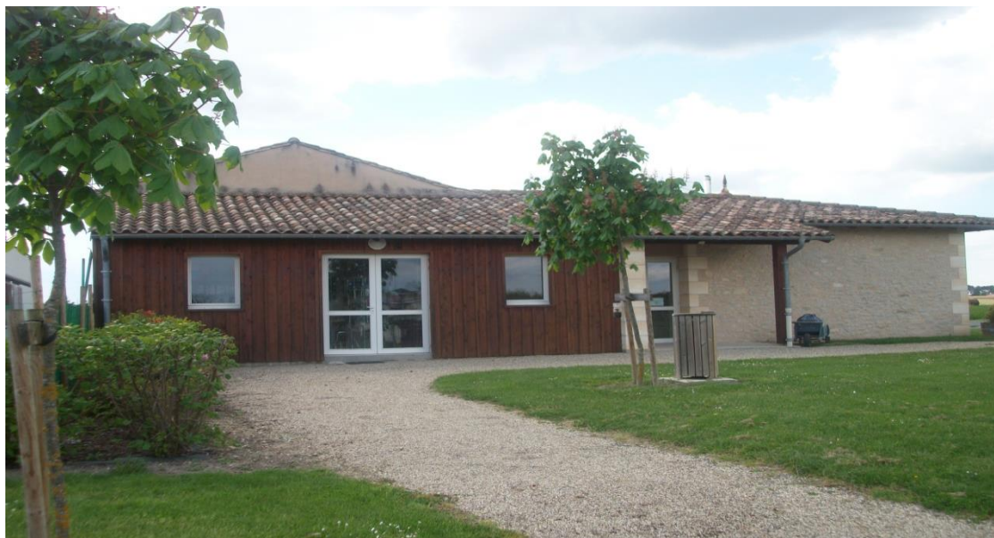
Maison des Associations