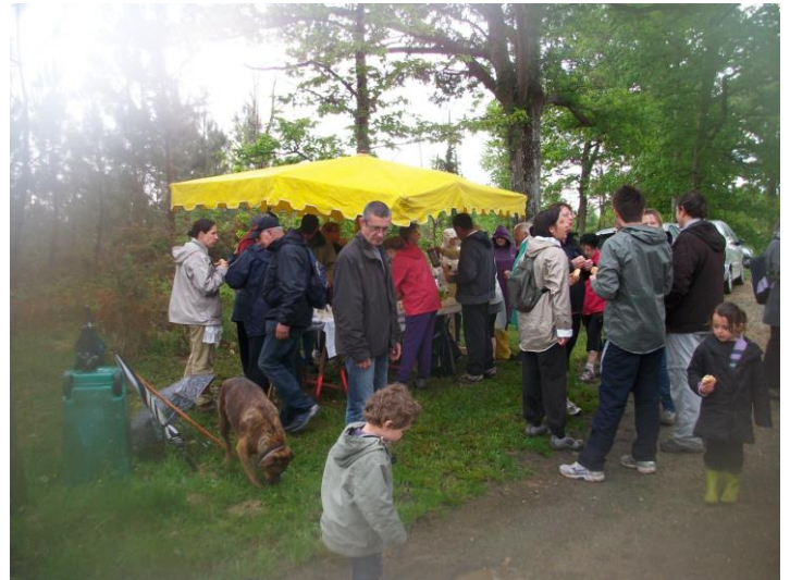
Marche du 1 er mai organisée par le comité des fêtes