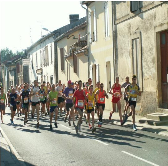
Comité des Fêtes « Trail »