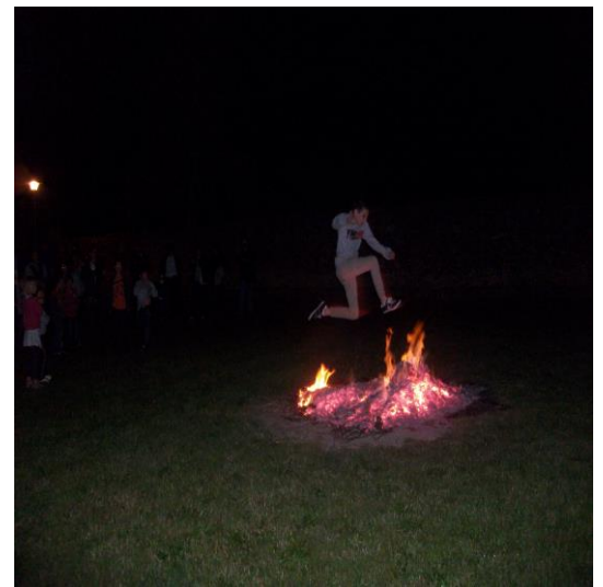
CIAP « Feu de St Jean »